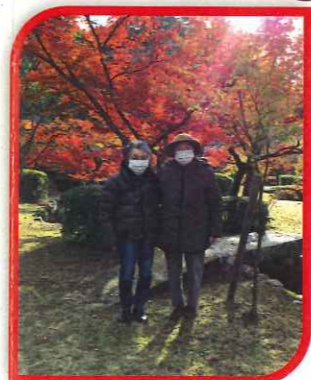
成溪公園と多久聖廟へ